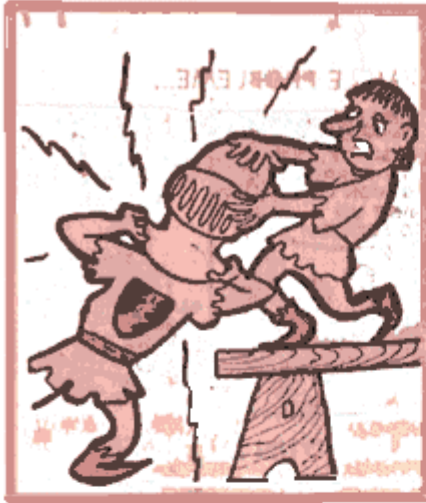
On djôze trop d'vos, vs avoz vosse tiêsse k' infèle

Rimontêyes di bèn rade on dimêye siêke, v'la co sakantès imaudjes po sayî d'vos fé rêxhe on pitit sorîre dsus vos lêbes. Dins l' tîmps, on vèyève co bèn cès ptits "dèssins umoristikes" dins totès lès gazètes. Asteûre c'èst fini. M'dîrîz bèn pokwè ?