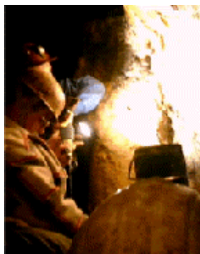
Figure 1 : Comint paurti lès biatés ?

strwèt èt drwèt rayon. I gn'a k'a léver s' tièsse po vîre c'ki