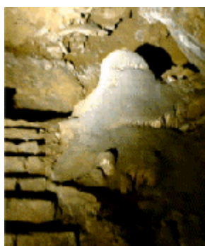
Figure 3 : Au wôt dès montêyes

lès rwèdeus do lèdmwin ! On n' vos va nén fé glèter èt vos cauzer d' totes lès biatés k' on z-a vèyu dzo tère. Après tot,