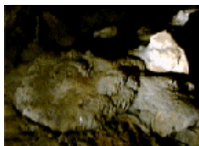
Figure 2 : On bouda d' lûjante

s' passe è l' aîr mins, po riwêfî à vos pîds i vos faut à make ployî vosse n' anète ! Bondjoû lès twartchaedjes èt