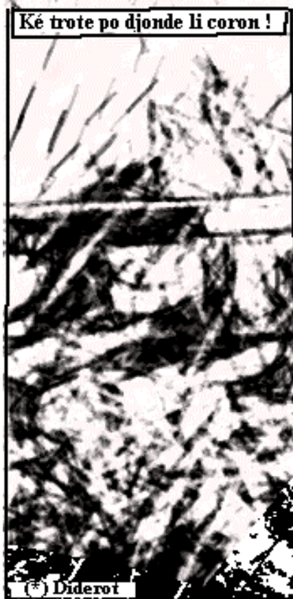
Ké trote po djonde li coron !

Chake sins à s' prope lingâdje. Li n'd' a pont da li; i n' vwèt nin, i n' ore nin, i n' pout rin sinte mins c' è-st-on bon translateu. Si dj' ènn' avève li tins, dji mètrève pus d' vèrité èt d' lumîre à cit arandjmint. Dji vos mostèrève on còp lès pates di l' aragne boudjant l' cwâr dèl bièsse, ène ôte fiye l' cwâr dèl bièsse fyant rinuwer lès pates. I m' faurève ètou ène niète dèl pratike d' on mède; i m' faurève... ni ripwazer, si vos plait bin, dj' ènn' a dandjî. (*)