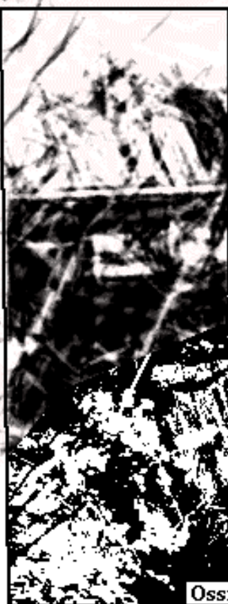
Ossi hén d' ène viève ki d' ène fauve ?